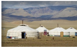
빠리쿤 유목민 게르