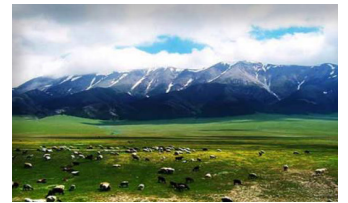
천산과 빠리쿤 초원